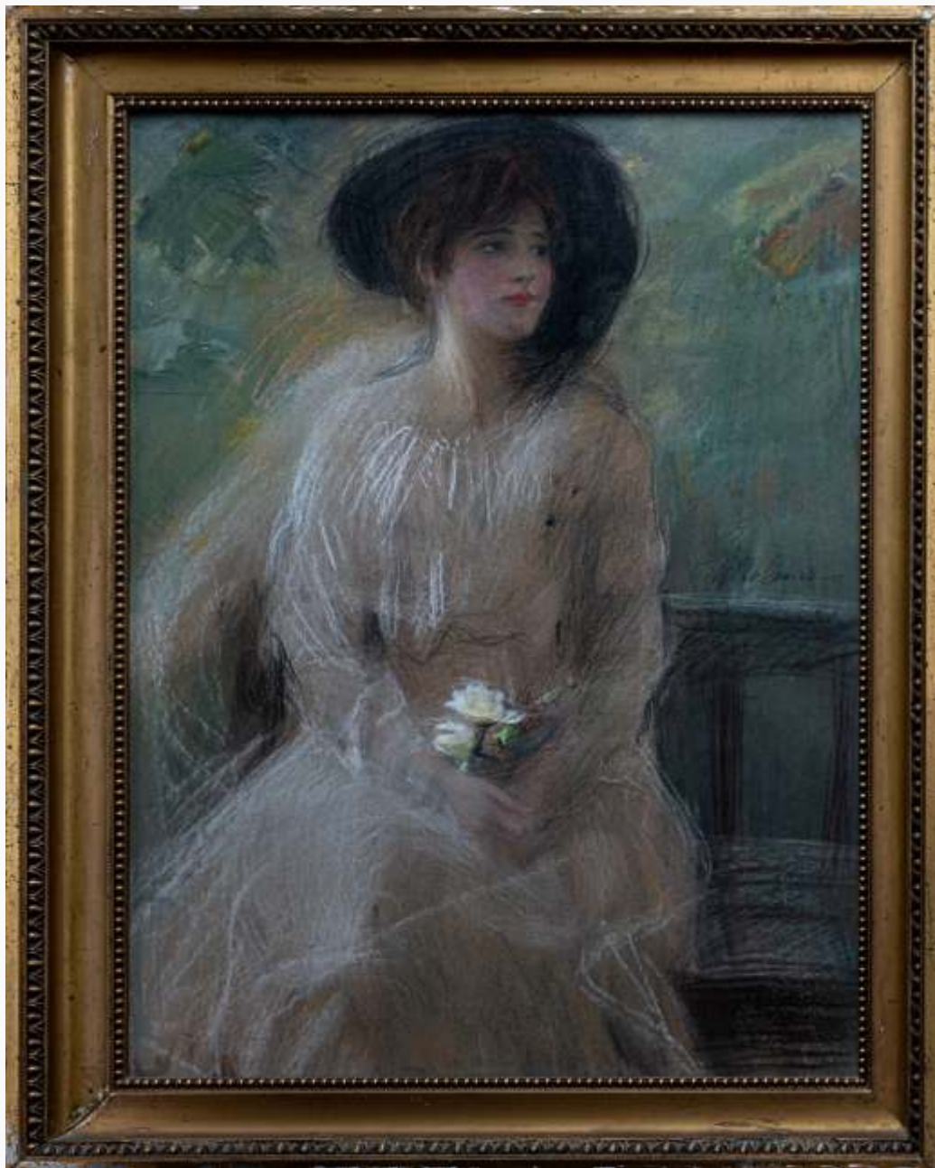
Teodor Axentowicz, Portret dziewczyny w czarnym kapeluszu Kraków, ok. 1913 r., pastel na papierze, MCH