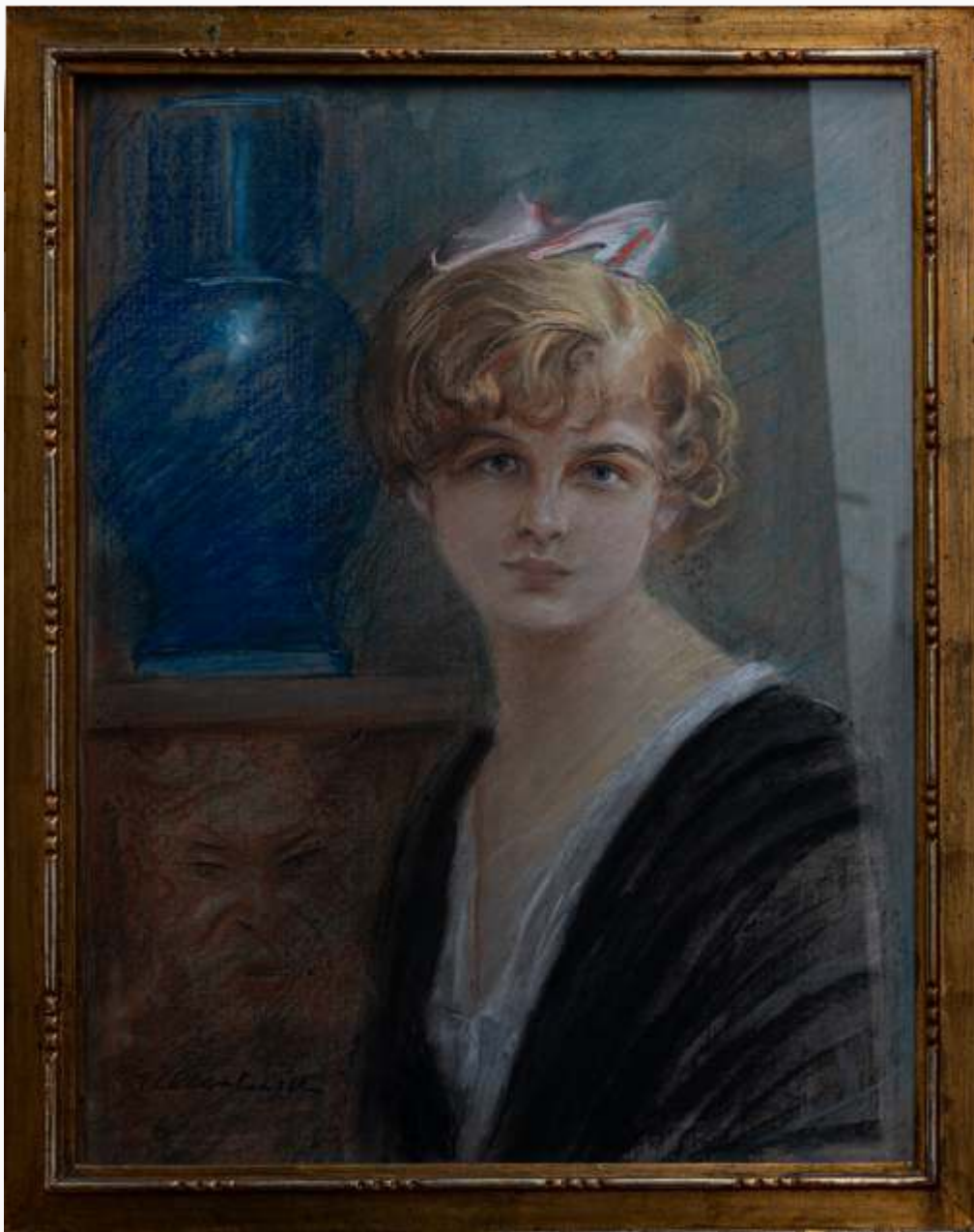
Teodor Axentowicz, Portret pięknej blondynki

Kraków, ok. 1916 r., pastel na papierze, MCH