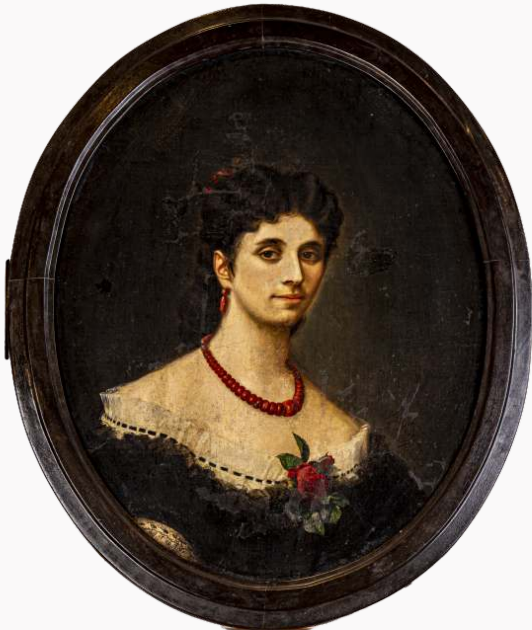
Andrzej Grabowski, Portret hr. Pauliny z bar. Heydlów Starzeńskiej Kraków, 2. poł. XIX w., olej na płótnie, MCH